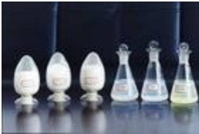
Powders and solutions of photocatalyst